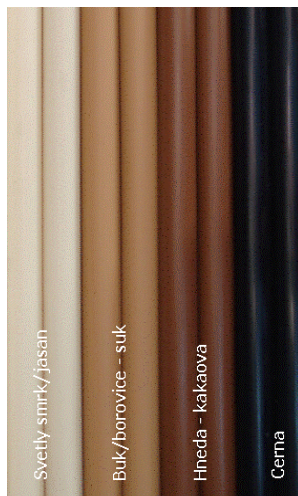
Doplňovací sáček č.2 světlý smrk/jasan, buk/borovice-suk hnědá-kakaová, černá